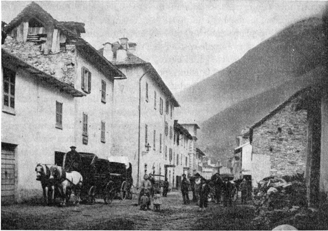
La diligenza sosta davanti alla vecchia posta di Gordola (1890–1900).

fin quasi al mozzo per cui si rese necessaria la costruzione di due muretti di sostegno fra il terreno e i due assali anteriore e posteriore per impedire che le ruote sprofondassero ulteriormente.