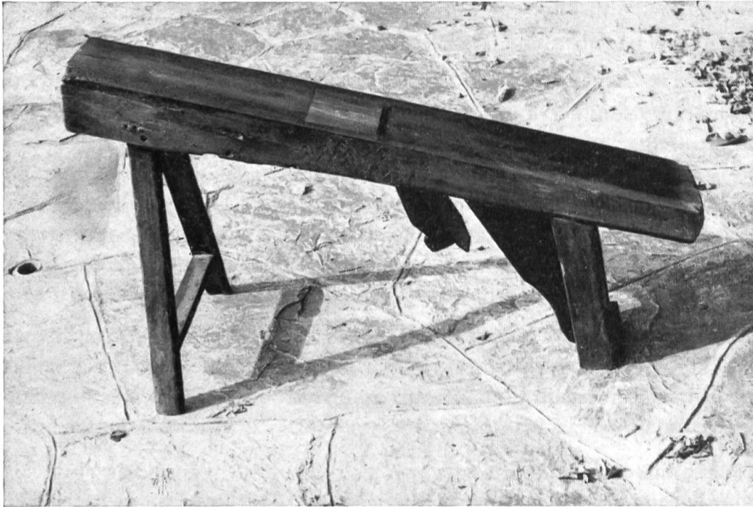
La colombe. C'est le grand rabot renversé des tonneliers et des charrons.