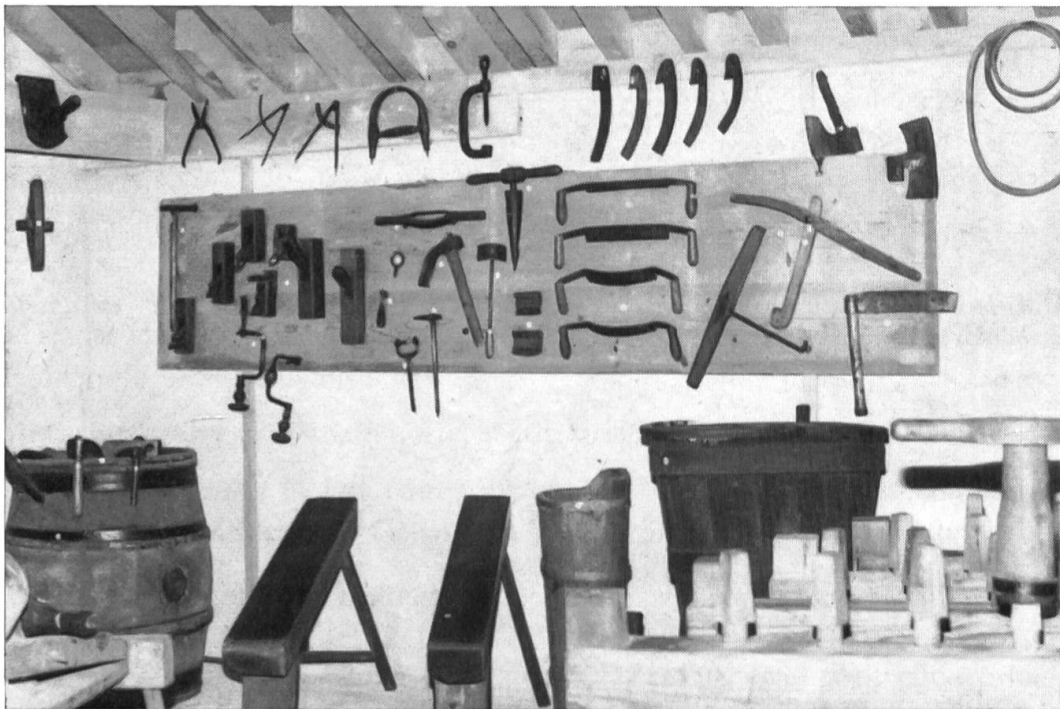
Dans le musée: le coin réservé aux métiers de fente (tonnellerie, boissellerie et tavillonnage).

Mais pour que cette pléthore de musées ne soit pas dévalorisante, il convient que chacun d'eux apporte quelque chose de nouveau par rapport aux autres.