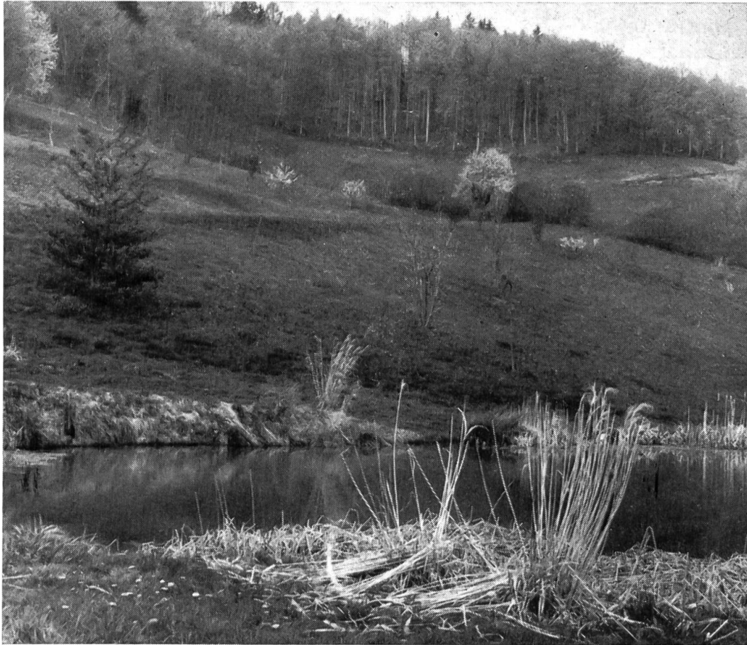
Un des secteurs de l'arboretum: au premier plan l'un des étangs créé de toute pièce, au second plan la collection des cerisiers (40 espèces).