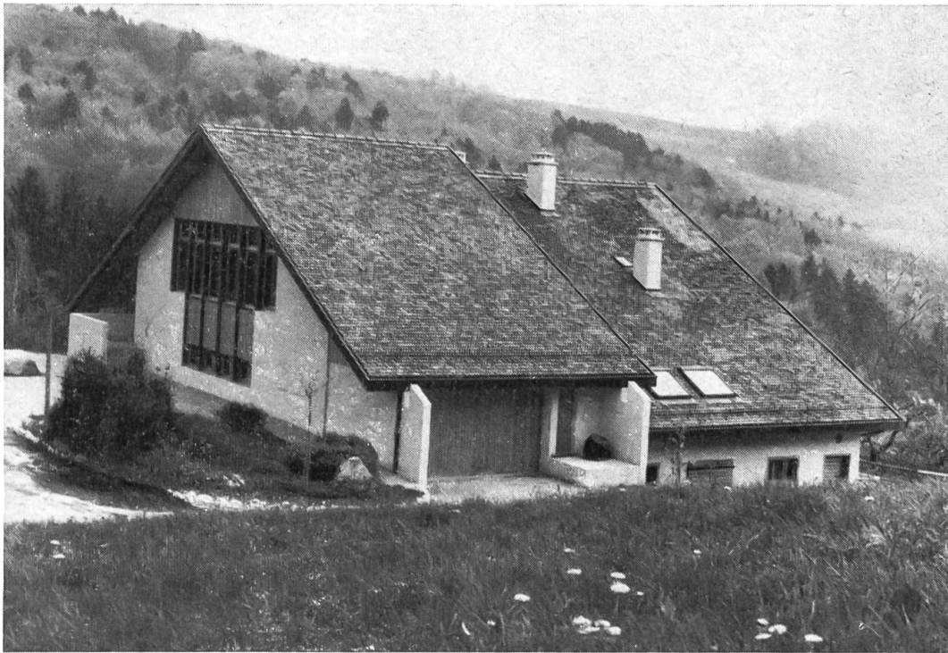
La ferme rénovée qui sert à la fois d'habitat pour le gérant du domaine, de centre de gestion, de lieu de rencontre et de musée.

D'emblée, on voulait éviter l'image stéréotypée du musée d'autrefois avec ses vitrines et sa poussière, avec la tristesse des objets présentés dans leur totale inertie et l'ennui du tablard aux étiquettes décolorées. Ce qu'on voudrait restituer dans ce «conservatoire», c'est le geste que suggère l'outil, c'est la vie de l'objet sorti de l'atelier; l'outil alphabet du geste, l'objet performance de l'esprit inventif et du savoir-faire de nos aïeux! Rural? Jusqu'à l'aube de ce siècle le bois était non seulement le seul combustible mais encore la principale matière première pour subvenir à tous les besoins d'une économie paysanne largement autarcique. Nos aïeux devaient suppléer à leur manque de liquidités par un esprit d'invention qui savait tirer parti de tout ce qui leur tombait sous la main, profitant du