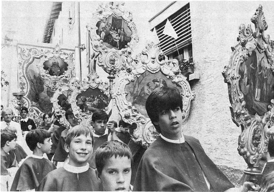
Fig. 6. Alcuni medaglioni della sera del Venerdì santo appaiono nella procesione della Beata Vergine del Rosario (Mendrisio, giugno 1985; cfr. L'Informatore a. VIII – n° 24, Mendrisio 14. 6. 1985).

piume), spesso ornate di stelline dorate (Melide). Qualche piccolo figurante aureolato indossava un saio o una tunica rifacendosi all'immagine di un santo. In mano portava una foglia di palma, un giglio o l'attributo del santo impersonato (Melide, Bissone). Non mancavano piccolissime con la testa cinta di una coroncina di fiori bianchi.