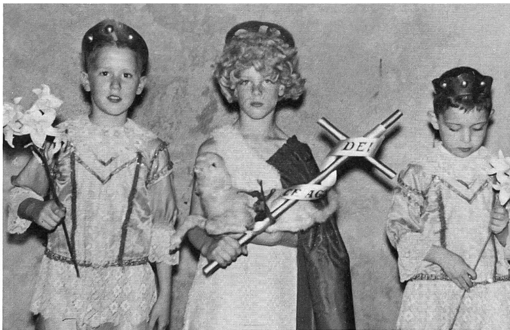
Fig. 5. Il San Giovannino della processione del Corpus Domini di Mendrisio, scortato dai due paggi con il giglio (1965); con la croce e il barin in braccio, veste un abito di seta rossa e di pelliccia bianca (l'aureola e i paggi son oggi scomparsi).

ricchi ricamati in oro e seta, le croci astili che venivano anche vestite, i lampioni, i misteri 4 , cioè medaglioni dipinti con scene sacre. In alcuni paesi si preparavano i cilostri (Sonvico, Barbengo, Lugano), composizioni floreali su aste 5 .