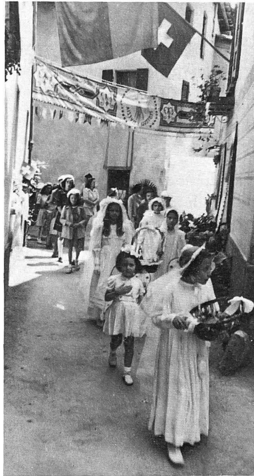
Fig. 4 Le «verginnelle» della processione del Corpus Domini a Melide (1942).

In occasione del Corpus Domini si vedevano esposte lungo il percorso sulle pareti delle case, alle finestre e su corde tirate fra pianta e pianta le lenzuola di lino ricamate dei preziosi corredi delle spose che venivano tolte per l'occasione dalle cassapanche e dai comò. Nel 1500 si alternavano anche coperte gialle di filaticcio di seta. In Valle di Muggio si esponevano le magnifiche coperte di lino tessute in casa a strette strisce. Esse venivano cucite assieme, tinte con colori naturali estratti prevalentemente da piante e poi impresse con stampi intagliati di legno e anche muniti di punte di ferro per formare meravigliose decorazioni floreali in tinte contrastanti 1 . Questi tessuti nostrani furono soppiantati da quelli a fattura meccanica. I preziosi manufatti muliebri nelle processioni furono sostituiti con bandiere alle finestre e file di bandierine multicolori cucite lungo una cordicella. Resisterono 2 le lunghe sandaline 3 , cioè i drappi tesi orizzontalmente in alto attraverso il percorso, sopra il passaggio degli oranti; alcune venivano anche appese verticalmente a lunghi pali (Ligornetto). Queste (rosse, bianche, gialle, spesso bicolori) potevano anche essere frangiate in giallo oro. I benestanti vi facevano perfino dipingere immagini religiose da pittori locali. I portali delle chiese venivano anche addobbati con drappi rossi frangiate (Muggio, Mendrisio). Non mancavano i devoti che allestivano