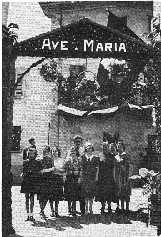
Fig. 2. Porta trionfale rustica a Melide (maggio 1939).