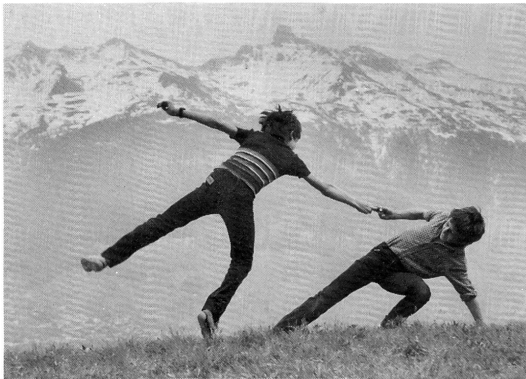
Le «Jeu: Tirer au Doigt»