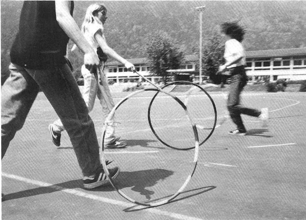
Le «Jeu du Cerceau»

rentes écoles du canton présentent d'abord leur démarche et le résultat obtenu puis mettent en parallèle leurs souvenirs de jeu de leur enfance. L'illustration de leur texte a été confié aux écoliers de Plan-les-Ouates. Une différenciation du texte imprimé par l'italique permet de s'orienter dans le temps. Nul besoin de dire que ce chapitre diachronique présente un document d'autant plus précieux qu'il a permis de sauver de l'oubli maint jeu traditionnel et d'en dater de nombreux nouveaux avec précision.