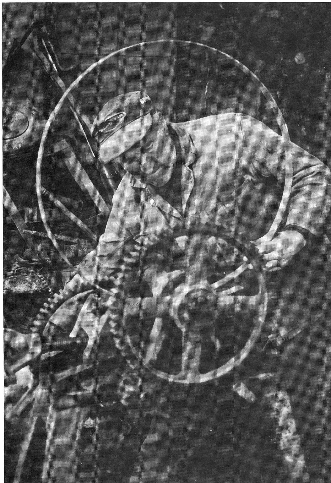
Le forgeron fait un cercle de roue