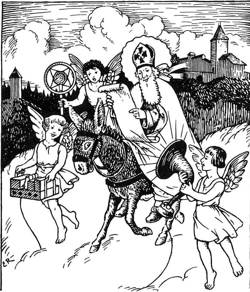
Fig. 1 Le peintre Eugène Reichlen a représenté ainsi l'arrivée de St-Nicolas à Fribourg, en 1935. Un jubilé!

de ses deux hommes noirs, les Pères Fouettards. Il y va d'un discours, d'un entretien familial, et de force conseils. On le verra ici ou là, de sa fête du 6 décembre jusqu'au Nouvel-An, invité qu'il est par les clubs ou les sociétés le jour de leur arbre de Noël.