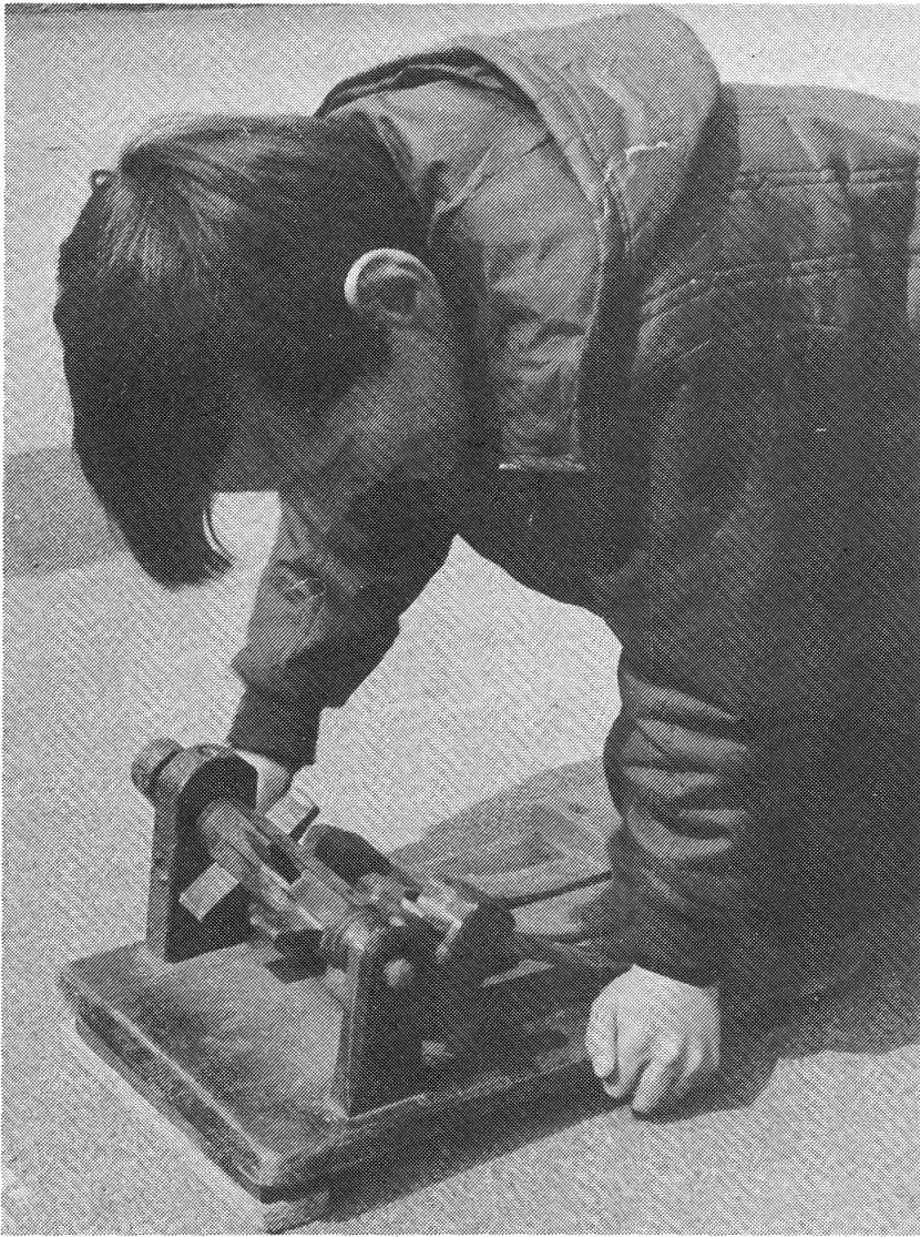
Fig. 2 Une crécelle romontoise. A la longue, c'est dur! On s'essouffle.

Au temps de Pâques. Cela commence le dimanche des Rameaux, par la procession et la bénédiction du rameau, lequel n'est plus aujourd'hui qu'une branche de buis ou de houx. Mais nous avons décrit plus haut (Le sapin) la particularité du rameau romontois, dont la coutume s'est bien conservée.