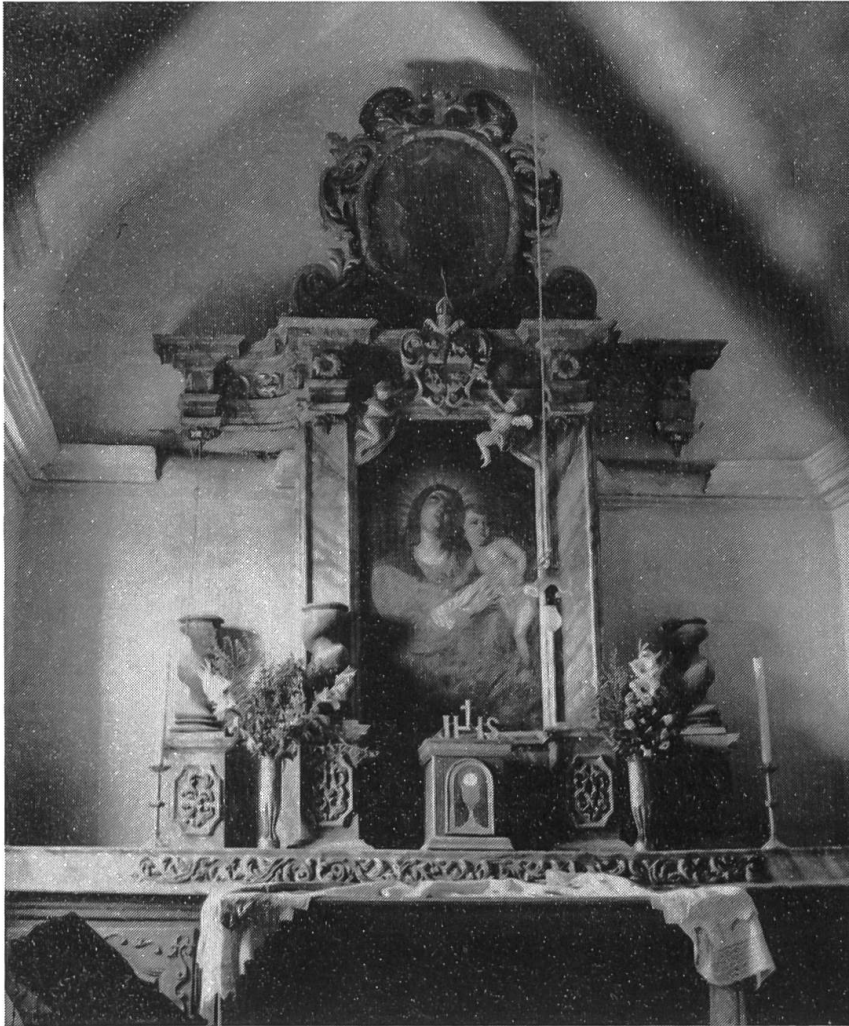
Fig. 3. Autel et tableau de Notre-Dame de la Nativité.