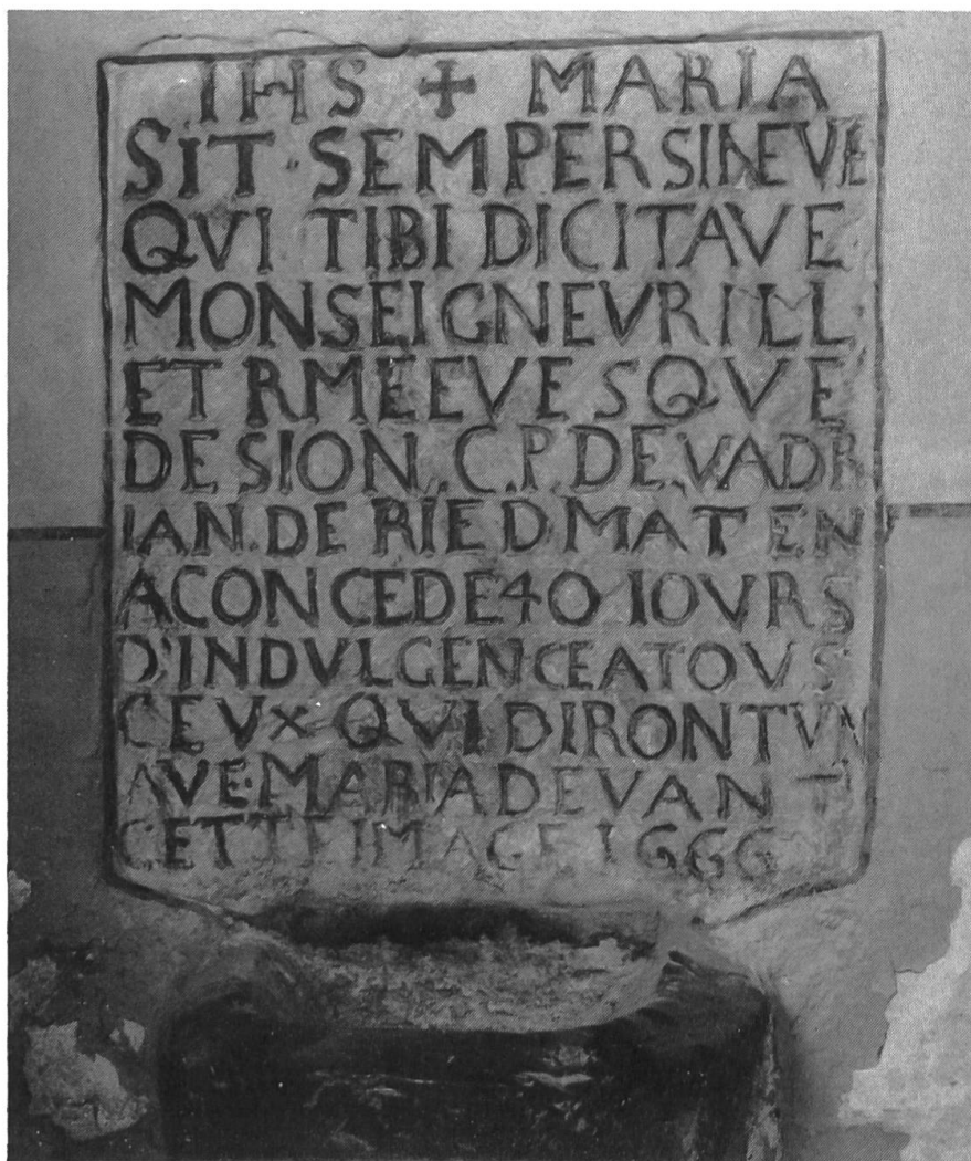
Fig. 4. Indulgence accordée en 1666 aux pèlerins.

décédé en 1971, a transmis à la rédaction du Folklore quelques notes fort succinctes et des photographies que nous aimerions présenter 25 ans plus tard.