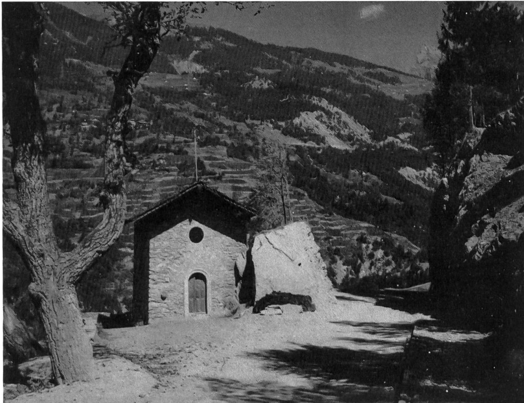
Fig. 1. La chapelle de Notre-Dame des Corbelins en 1963, après la percée du rocher pour la route du Sanetsch, vue vers le nord.

Le Centre d'Etudes francoprovençales René Willien de Saint-Nicolas , Vallée d'Aoste, a publié en 1987 un volume de travaux choisis dans les Concours Cerlogne 1 et concernant le baptême 2 . Depuis plusieurs années le Centre souhaitait la publication d'une partie des travaux présentés chaque année par plus d'un millier d'élèves et leurs enseignants. Avec ce premier livre qui sera rapidement suivi d'autres, le Comité du Centre aimerait faire mieux connaître et apprécier la valeur documentaire des travaux de concours, mais aussi rendre hommage aux enseignants et aux élèves qui œuvrent pour le patois et sa survie.