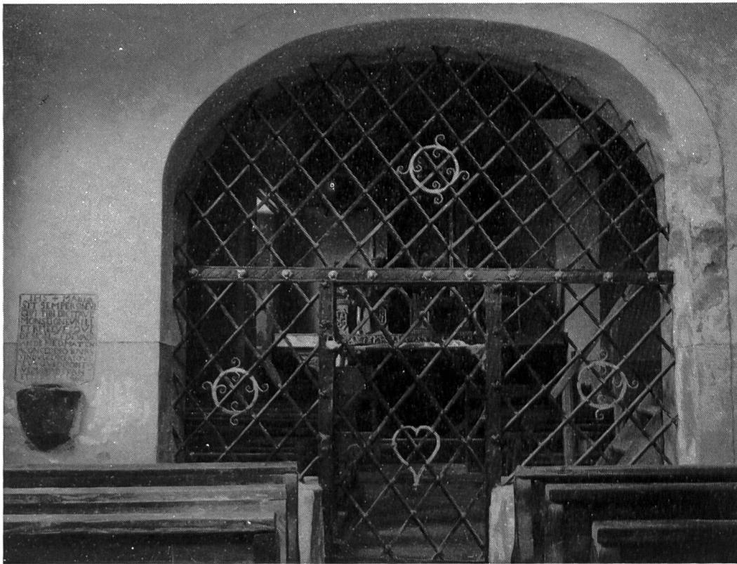
Fig. 2. Vue sur le chœur de la chapelle.

seignements et contribue efficacement à la connaissance de la culture et des traditions dans le domaine francoprovençal.