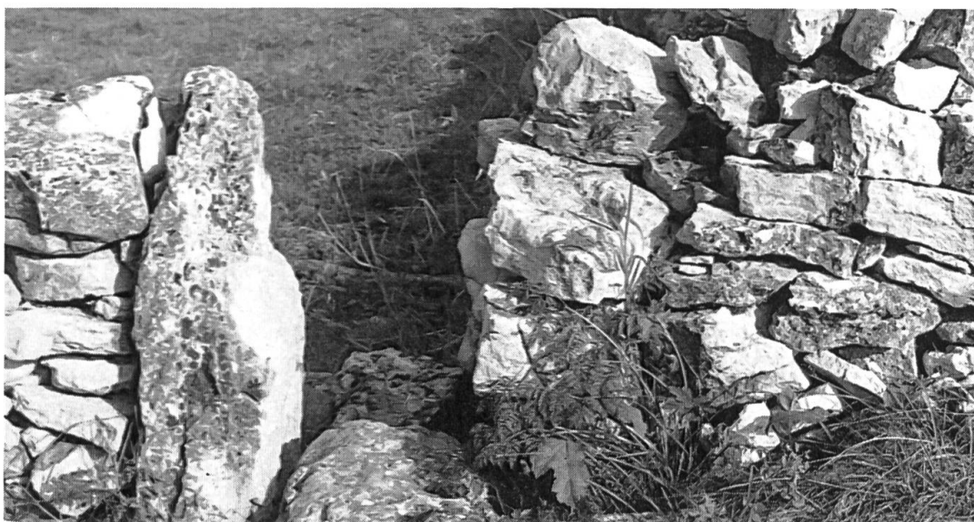
Photo n° 6: quand on observe les murs en pierre sèche dans le détail, on découvre le soin avec lequel ils furent construits; afin de faciliter leur franchissement par les humains tout en empêchant le passage des bestiaux, on aménageait des péssous (La Chaux-des-Breuleux).