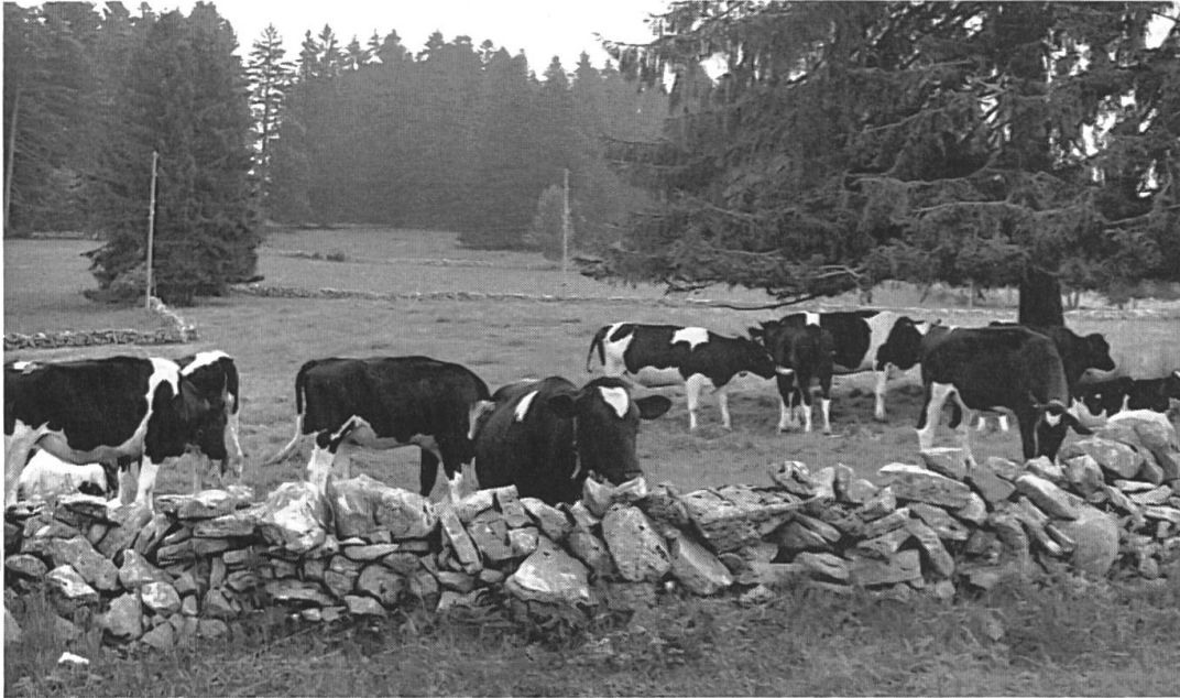
Photo n° 2: mur en pierre sèche passablement délabré mais remplissant néanmoins encore son rôle (La Large Journée).