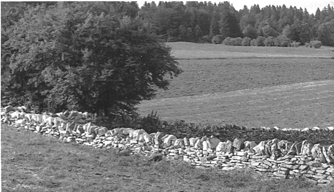
Photo n° 3: au XVIII e siècle, pour lutter contre la ruine des forêts, le prince-évêque de Bâle préconisa le remplacement des clôtures en bois par des murets et des haies pour séparer les terres cultivées des pâturages; il fut entendu, comme en témoigne présentement le paysage franc-montagnard (Le Peuchapatte).