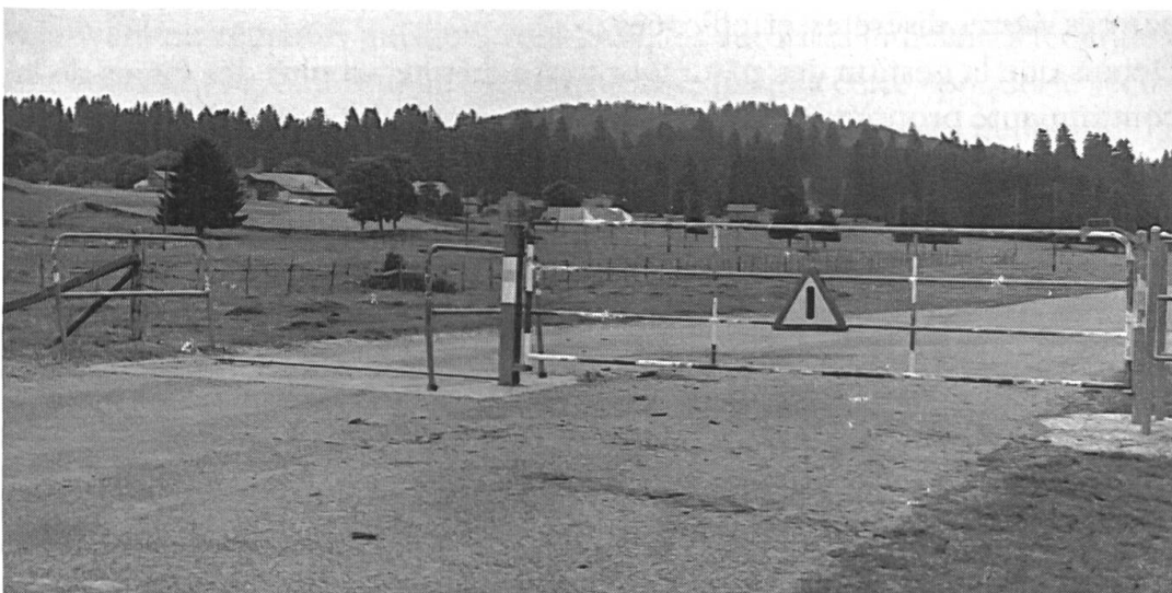
Photo n° 9: barrière actuelle avec «bovi-stop»; le métal a remplacé le bois (Les Cufattes).