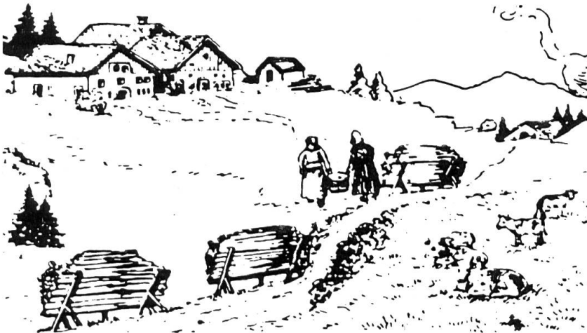
Dessin n° 2: la barre morte , soit la barre de couche mise en tas au terme de la vaine pâture sur les jachères (dessin de Joseph Beuret-Frantz).

Alors que le troupeau était naguère encore généralement ramené à la ferme pour la traite, on assiste aujourd'hui à la construction d'abris, de loges sur les pâturages, et le lait est transporté directement à la laiterie.