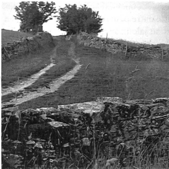
Photo n° 5: les nouvelles closures furent parfois créées à partir des pâtures et le pâturage devint alors juste assez large pour assurer le passage des gens et des bêtes (Les Rottes).