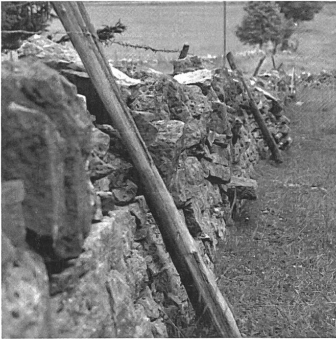
Photo n° 7: autre aide au passant qui veut franchir un mur en pierre sèche: la marche (Le Cerneux-Joly).