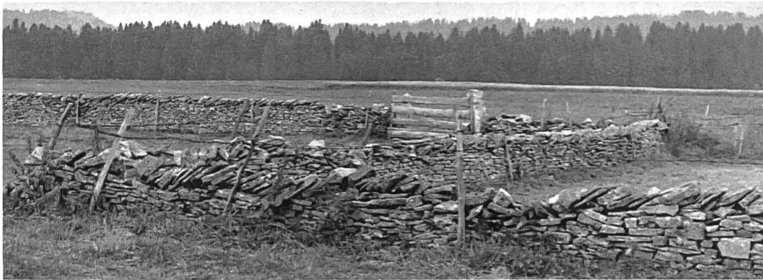
Photo n° 4: aux XVII e et XVIII e siècles, le défrichement des Franches-Montagnes se poursuit activement par la création des nouvelles closures ; les murs en pierre sèche attestent qu'on ne manquait pas de fantaisie pour tracer les limites des parcelles ainsi gagnées sur la forêt; seul le clédar ou portail était encore en bois; au lieu de réparer ces murets, on préfère planter quelques piquets et tendre un fil de fer barbelé, et c'est bien dommage (Les Rouges-Terres).