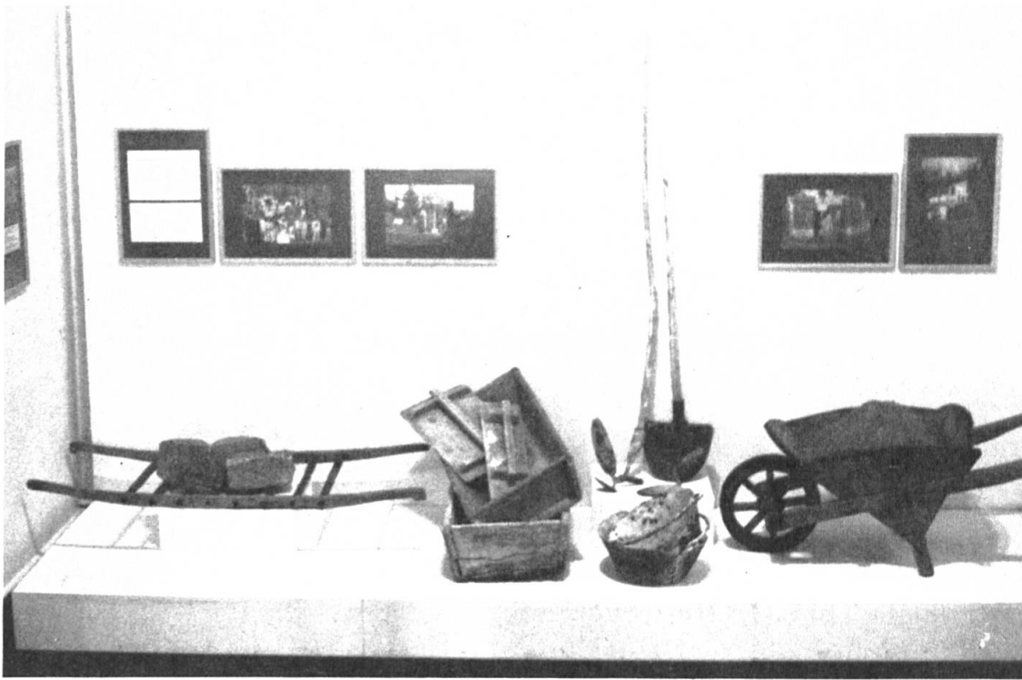
Fig. 5 Corso per muratori. Stabio.