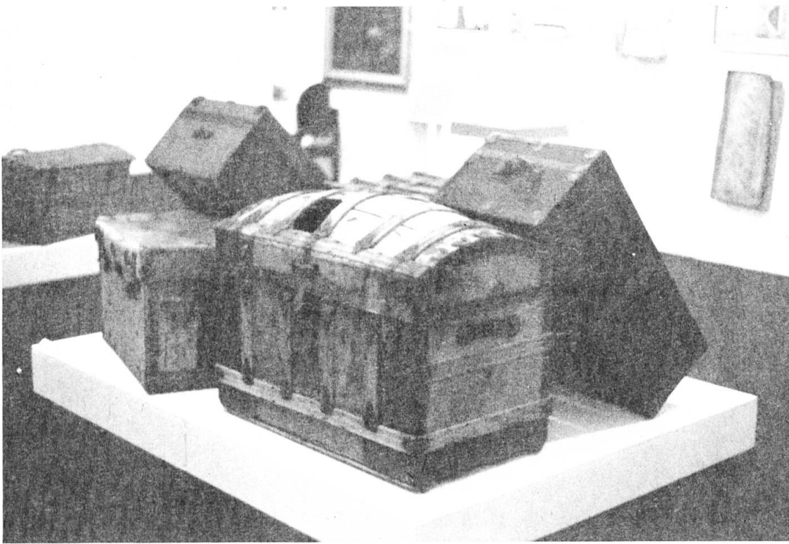
Fig. 4 Bauli di emigranti. Emigrazione oltre oceano.