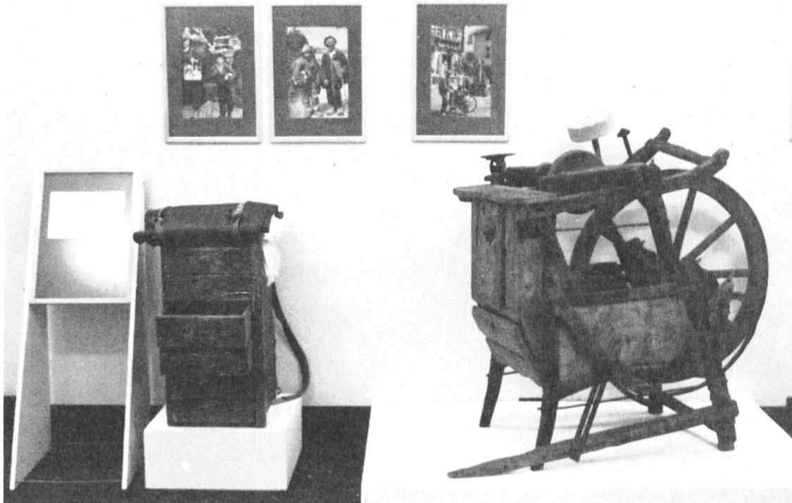
Fig. 2 Professioni girovaghe

Tutta la storia dei rapporti fra le comunità del mondo alpino e i centri popolosi nelle pianure è caratterizzata da questi scambi e da prestazioni di lavoro di artigiani, operai, contadini, ecc.