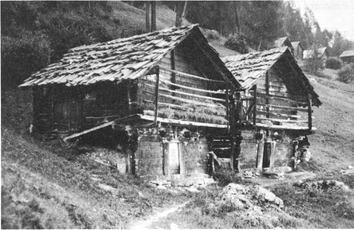
Fig. 3: «Granges-écuries» à Hérémente.

attentivement la description des immeubles mis en vente, on s'aperçoit qu'il ne s'agit en tous cas pas d'un mazot, et généralement pas non plus d'un raccard. Ces deux mots semblent devenus, selon le promoteur immobilier, synonyme de vieille bâtisse plus ou moins délabrée, ou au moins «typique» pour attirer les acheteurs nostalgiques du passé.