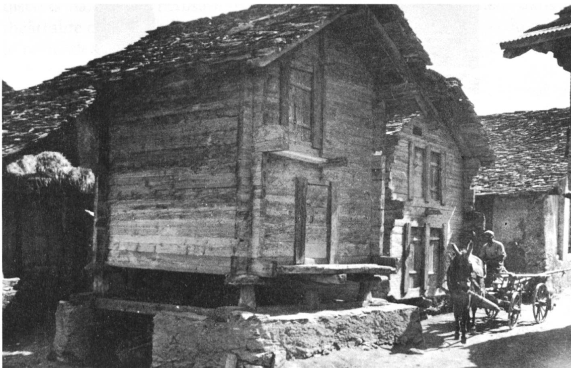
Fig. 4: Grenier à Lens (Photo E. Schüle).

attentivement la description des immeubles mis en vente, on s'aperçoit qu'il ne s'agit en tous cas pas d'un mazot, et généralement pas non plus d'un raccard. Ces deux mots semblent devenus, selon le promoteur immobilier, synonyme de vieille bâtisse plus ou moins délabrée, ou au moins «typique» pour attirer les acheteurs nostalgiques du passé.