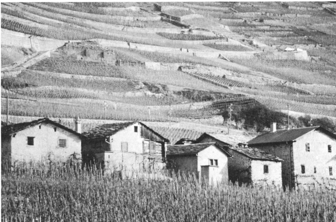
Fig. 1: Mazots à Fully en 1988.

Dans cette région, «mazot» signifie «pied-à-terre, petite maison où l'on peut vivre provisoirement loin de chez soi, le temps d'effectuer des travaux saisonniers: s'applique presque exclusivement à des maisons de vignes».