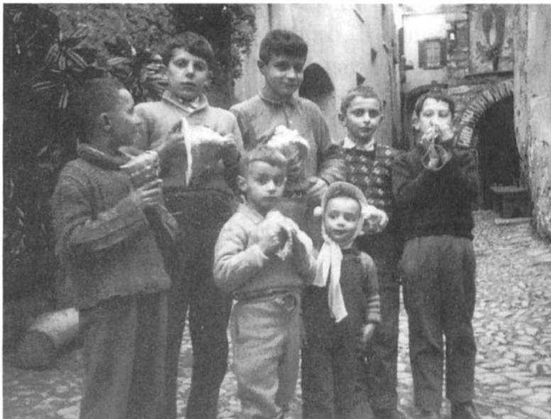
Fig. 3 Gruppo di ragazzi con i taratatu (1960).