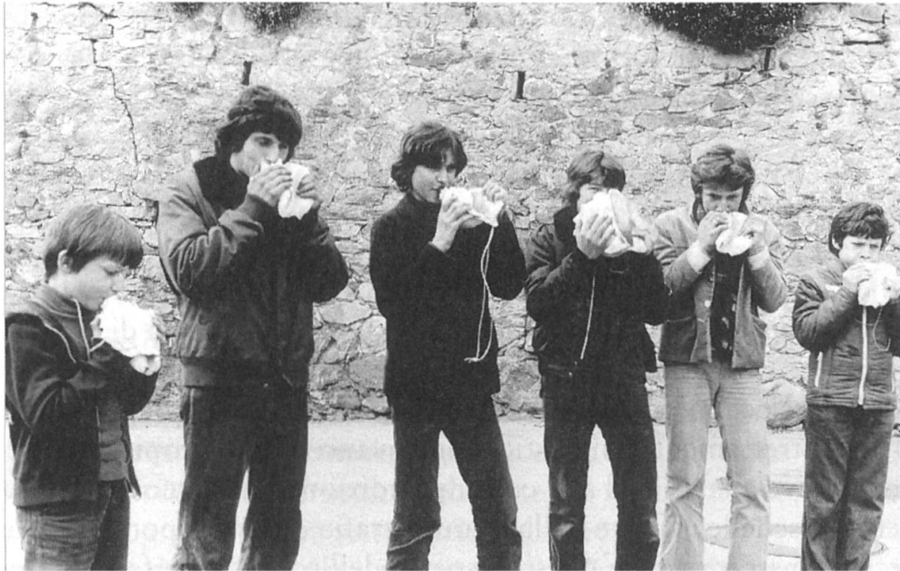
Fig. 4 Gruppo di oggi (1990).

Le strofe citate prima; sono cantate anche il Sabato Santo, con l'unica differenza che le parole «mangia di magro» sono sostituite con «mangia di grasso». Come tutti sanno, non si aspetta il capretto con contorno del dì di Pasqua per festeggiare la risurrezione del Signore; si comincia la vigilia.