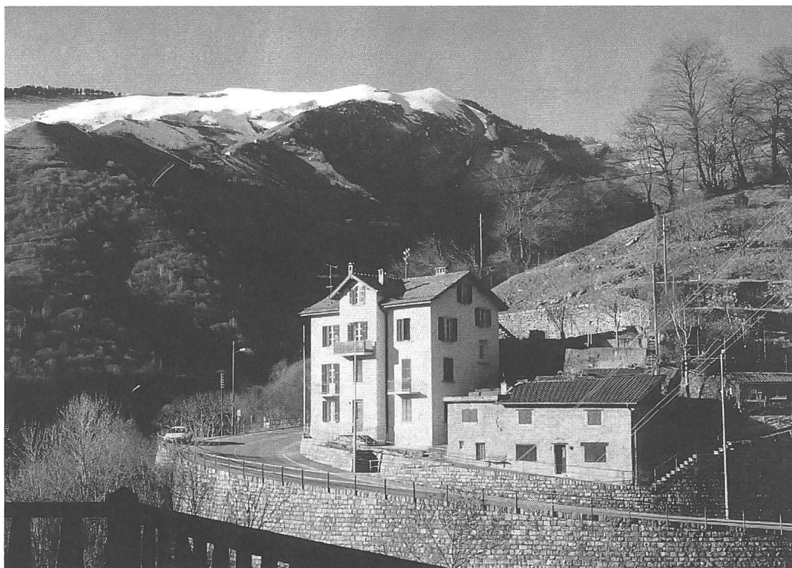
Ex casa delle guardie a Muggio sulla strada che porta a Scudellate, ultimo paese della valle.