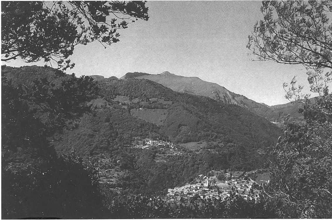
Panorama della Val di Muggio, sullo sfondo il Monte Generoso.