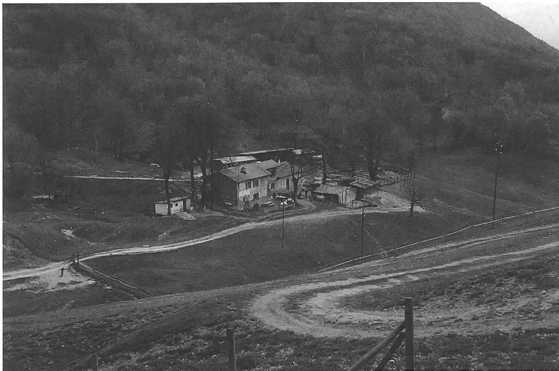
Nucleo rurale dell'Alpe Grassa.