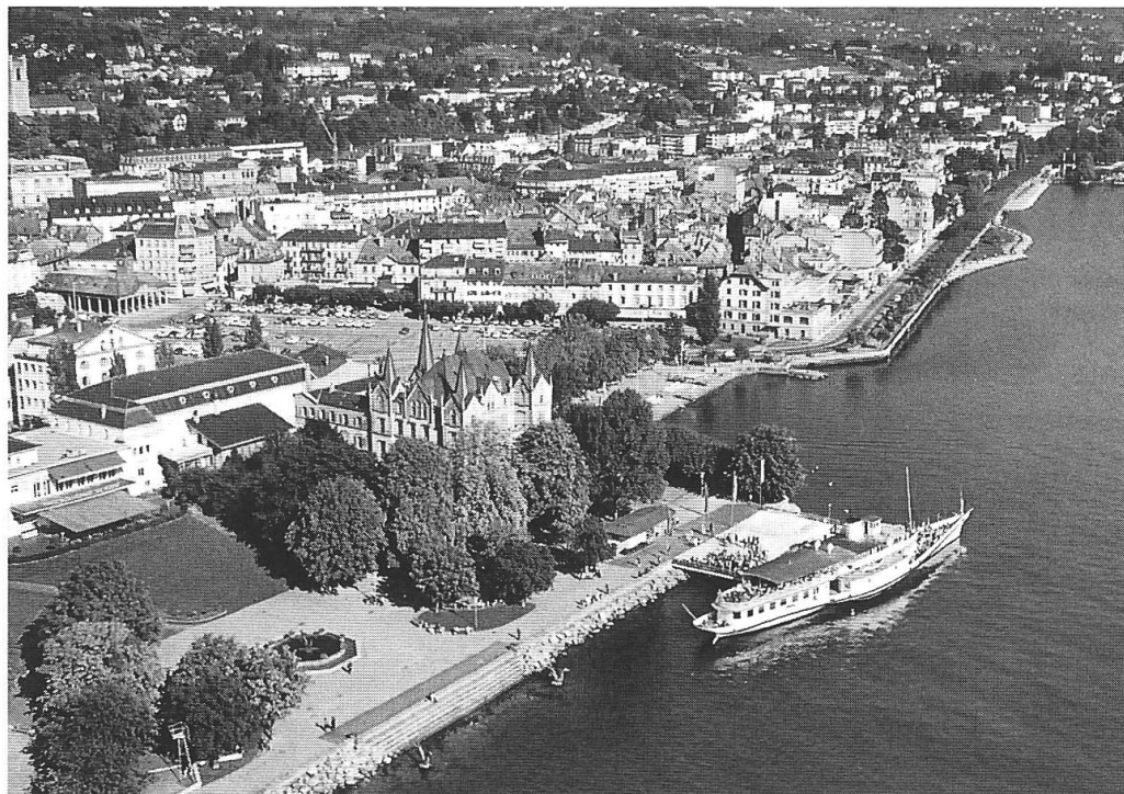
Ill. 1: Vevey et sa Grand-Place (place du marché).

La prochaine assemblée générale de la SSTEP se déroulera à Vevey et dans ses environs les 26 et 27 septembre 1998. Cette ville de 15700 habitants se prépare pour la prochaine Fête des vignerons de 1999. Il n'y a que quatre ou cinq fêtes par siècle. Nous traverserons la Grand-Place où elle se déroulera: avec ses 20000 m 2 , elle est la deuxième plus grande place de marché d'Europe, après celle de Lisbonne (ill. 1).