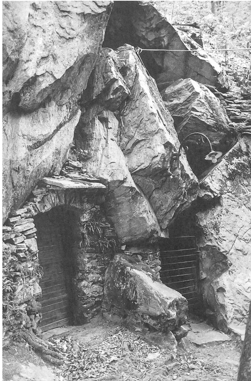
Due entrate di cantine che fanno parte dell'interessantissimo complesso di grotti a Ponte Brolla.

nelle zone più miti, del vino. Le cavità naturali già presenti quasi sempre furono amplificate con degli scavi, inoltre furono costruiti delle scalinate o dei cunicoli d'accesso. Mentre per le cantine prevale la funzione di luogo di stoccaggio, i grotti costituiscono inoltre anche un posto dove ci s'incontra dopo il lavoro o la domenica e si consuma tali prodotti. Gli odierni ristoranti pubblici sono nient'altro che un'evoluzione di questa funzione originale. Il locale di conservazione di un grotto in pratica è identico a quello di una cantina , ma un grotto possiede inoltre di un edificio adiacente la cantina o almeno di un tavolo e delle panchine poste davanti all'entrata.