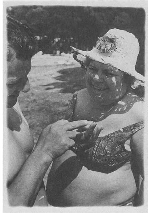
Abb. 2: Boris Mikhailov, aus der Serie Berdyansk Beach , 1981, Silbergelatineabzug, 41 x 30 cm. In: Diane Neumaier (Hg.): Beyond Memory: Soviet Nonconformist Photography and Photo-Related Works of Art . New Jersey 2001, © 2011, ProLitteris, Zürich.

Der menschliche Körper war ein wichtiges Forschungsfeld Mikhailovs. Seine Serie Berdyansk Beach (1980er-Jahre) deckt auf, was die Bilder des Sozialistischen Realismus nicht zeigen. Man sieht vorwiegend übergewichtige, ältere Menschen, die an der Krimküste die Ferien geniessen. Keiner arbeitet, sondern sie frönen dem Nichtstun (Abb.2). Wo sind nun also diese schönen, starken Sowjet-Menschen, die wir von den Bildern kennen? Was wir sehen, sind schlicht und einfach ganz normale Menschen, die auch mal ein paar Kilos zu viel auf den Rippen haben. Mikhailov verstand es als seine Aufgabe, den Ideal-Körper zu enthüllen und auch den hässlichen Körper verstärkt zu zeigen, und meinte: «Anthropologically speaking, the human body had changed. The hero had become fat, obese. He took vacations. He got naked and ceased being merely Soviet, or a social being.» 8