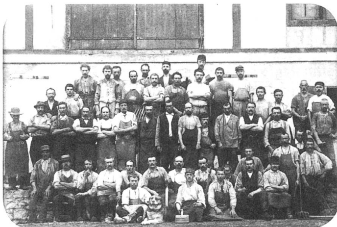
Tannerie Raymond Morges, 1892. (21 x 15 cm). Aus: Hugger, P./ Wolf, R: Wir sind jemand. Bern 2012, S. 153.

Toujours en recherche de photographies inédites et désireux d'éviter la perte de la mémoire argentique, Paul Hugger a lancé une série de livres avec des photographies d'archives «Foto-Archive der Schweiz» prévue en 7 volumes.