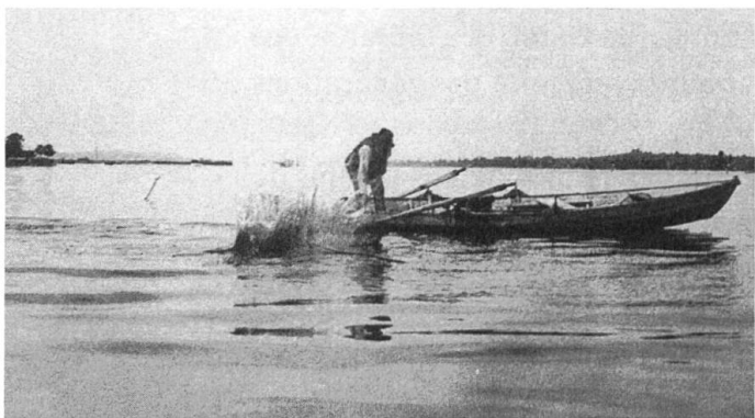
Pêcheur d'Ermatingen. Adolf Ribí, 1932. Aus: Hugger, P. (Hg.): Foto-Archive der Schweiz, Nordost-Schweiz. Sulgen 2014, S. 197.

Dans la série «Lac de Constance», des vues d'Adolf Ribí montrent des pêcheurs d'un autre temps, dans des instantanés parfois violents, comme ces poissons qui se débattent avec la capture.