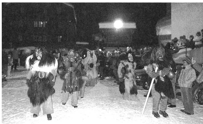
Für einige Maskenläufer der absolute Hit, anderen zu durchorganisiert: Umzug vom Fetten Donnerstag Nacht (Blatten, Feystä Vrontag 2010)

Auch aus anderen Gründen suchen wir an den Fastnachtsnachmittagen oft umsonst nach Maskierten: Aus den früheren Bauern sind, wie vielerorts im ländlichen Europa, Angestellte geworden, die tagsüber in den umliegenden Kreisstädten arbeiten und erst abends ins Tal heimkehren – genau dann, wenn das Maskenlaufen mit dem Betzeitläuten vom Kirchturm um 18 Uhr laut der früheren Tradition endet. Daher verboten Dorfpolitiker Mitte der 1980er Jahre nach dem Motto «Brauch bleibt Brauch» das Maskenlaufen nach 18 Uhr. Am Anschlagkasten der Gemeinde Wiler beispielsweise hing damals ein Zettel, der mit den Worten schloss: «Fehlbare riskieren eine Anzeige mit Strafverfahren.»