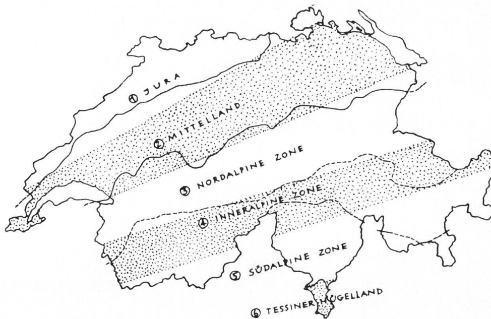
Abbildung 2: Natur- und Wirtschaftszonen der Schweiz nach Richard Weiss (aus: Häuser und Landschaften der Schweiz, S. 189)

Richard Weiss unterschied vor 25 Jahren in seinem Buch über Häuser und Landschaften der Schweiz fünf grössere Natur- und Wirtschaftszonen, nämlich den Jura, das Mittelland, das nordalpine, inneralpine und südalpine Gebiet 8 . Die Nordabdachung der Alpen mit ihrem feuchten Klima charakterisierte er als Zone vorwiegender Viehwirtschaft mit alpwirtschaftlicher Ausprägung. Im niederschlagsärmeren inneralpinen Gebiet sah er eine selbstversorgerische Mehrzweckwirtschaft, die sich auf Viehwirtschaft, Ackerbau und im Wallis sogar auf Weinbau stützte. Für die südalpine Zone seien die (der inneralpinen Mehrzweckwirtschaft verwandten) Doppelkulturen typisch, nämlich die gleichzeitige Verwendung desselben Grundstücks zum Beispiel für Wein- und Ackerbau. Diese bestechend analytische Einteilung hat für den Wirtschaftshistoriker den Nachteil, dass sie im einzelnen zu wenig konkret ist. Wie auf Abbildung 2 ersichtlich, zog