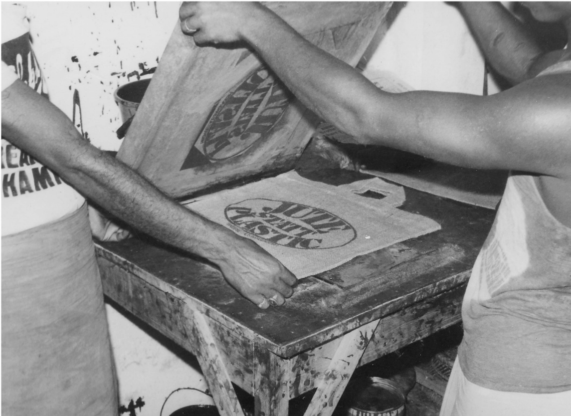
Abb. 3: Aktion Jute statt Plastic: Produktion und Druck der Jute-Taschen in Bangladesh.

Kunden vermittelt werden sollten: auf der Produktion der Taschen durch Frauenkooperativen in Bangladesh, auf der Weiterverarbeitung der Jute im Land selbst, auf den Konsumgewohnheiten in der Schweiz und schliesslich auf einem Energiebilanzvergleich der Herstellung von Jute-Taschen und Plastiksäcken. Einschränkend wird von Jute als «symbolischer Alternative zu dem, was uns die Chemie anzubieten hat», gesprochen sowie deutlich gemacht, dass die Aktion «nicht um eines möglichst grossen Geschäftswillens durchgeführt [werde], sondern als symbolische Aktion, als Aufhänger und Motor zu Informationsarbeit zur Thematik Entwicklungspolitik/Ökologie/Lebensstil». 27 Wieder war das Produkt, diesmal die Jute-Tasche, das Vehikel für den Informationstransport, mit und an ihr wurden die Anliegen eines gerechten Handels- und Wirtschaftssystems an die Schweizer Konsumentinnen und Konsumenten vermittelt. Der Verkauf der Taschen fand, analog zur Ujamaa-Kaffeeaktion , vorwiegend über Gruppen statt, die sich mit dem Informationsmaterial umfangreich vorbereitet hatten. Die Informationsvermittlung geschah in einer ersten Phase vor allem über Strassenverkäufe, die von kirchlichen Gruppen oder Dritte-Welt-Läden durchgeführt wurden. Die Jute-statt-Plastic-Aktion war ein enormer Erfolg, die Taschen fanden reissenden Absatz, die produzierenden Frauenkooperativen in Bang-