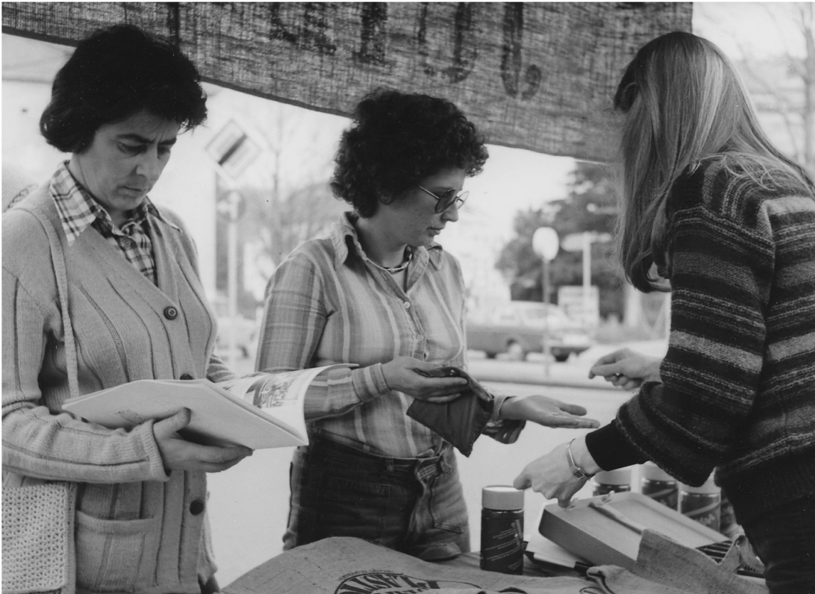
Abb. 1: Strassenverkauf von Jutetaschen und Ujamaa-Pulverkaffee. (Schweizerisches Sozialarchiv, F 5028-Fx-12)

Gründung der Importgenossenschaft Schweiz – Dritte Welt (OS3) angegangen. Dass ein Unternehmen dabei teilweise aus der theoretischen Reflexion ökonomischer Entwicklungsparadigmen entstand bzw. aus der Kritik an einem festgestellten bestehenden Missstand des Weltwirtschaftssystems, der sich für die Entwicklungsländer nachteilig auswirkt, ist bemerkenswert – richtet sich doch dieses Unternehmen nicht primär nach dem Markt aus, sondern nach den Bedürfnissen der Bevölkerung der benachteiligten Dritten Welt.