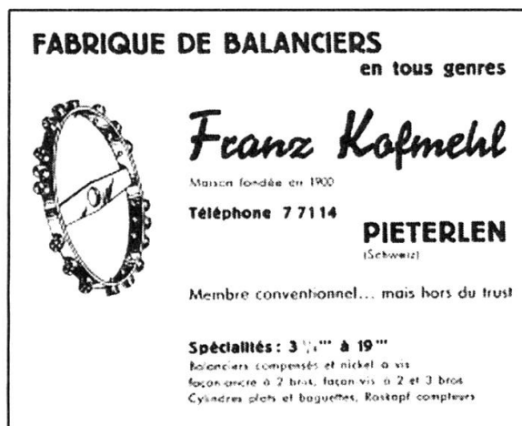
Illustration 1: Publicité de 1941. Indicateur Davoine 1941, p.462. L'intégration de l'entreprise Kofmehl au trust des FBR est réalisée durant l'exercice 1954/55 seulement. Voir AFS, E 7004/1967/12/55: ASUAG, Rapport annuel de gestion, 1954–1955, p.6.

du spiral Straumann. L'ingénieur bâlois semble d'ailleurs avoir su pleinement tirer profit de la situation, puisqu'il devient administrateur de la nouvelle entreprise Nivarox S.A. 50 Dès lors, l'ASUAG et ses sociétés-filles parviennent à juguler les dissidents en les sevrant de pièces-maîtresses de première qualité. Ces actions coordonnées sont bien évidemment efficaces, dans le sens où elles ont sans aucun doute contribué à corseter l'ensemble de la branche horlogère suisse. Les plus faibles, acculés, sont poussés à signer la convention collective et à intégrer les associations patronales (FH ou UBAH). Les plus résistants par contre parviennent à l'ombre de la Seconde guerre mondiale, à négocier financièrement leur intégration dans la structure industrielle de la Société Générale de l'Horlogerie Suisse S.A. En ce sens, la politique industrielle de l'ASUAG débouche en 1941 sur un contrôle technologique des quatre marchés, doublé d'un appui juridique de droit public et privé.