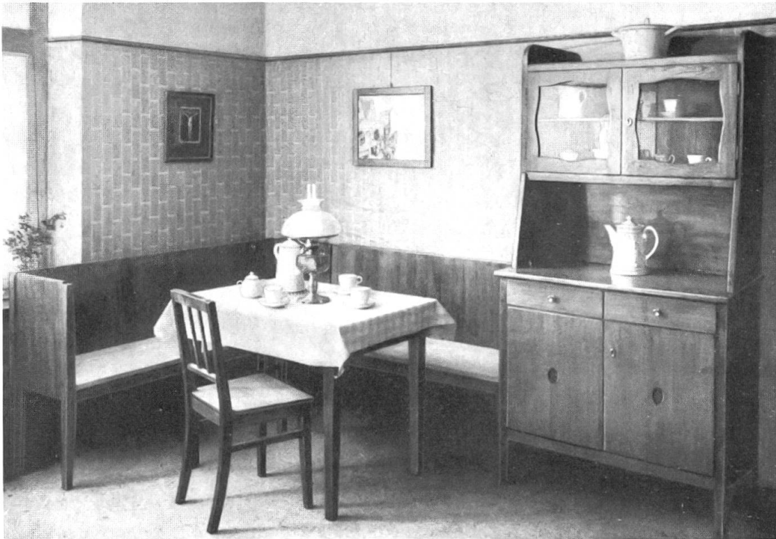
Abb. 1: Wohnküche, nach einem Entwurf von Max Heidrich, Paderborn. Aus: Staudinger, Die Wohnung , S. 210.

können, der allerdings mit einer normativen Setzung von Frauen als Ehefrauen und Mütter einhergeht: «Die Väter dürfen uns das nicht verübeln, dass wir [Frauen] zuerst an die Kinder denken; – es ist doch nun leider heute einmal so, dass der Hausvater am allerwenigsten zu Haus ist und am wenigsten Gebrauch von der Wohnung macht; [...] wir meinen, die Wohnung ist zu allererst für die da, die sie ständig benutzen: Mutter und Kind.» 19