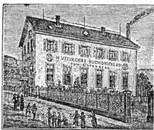
(M 2278 Z) 5

Zeilenpreis für Insertionen: die halbe Spaltenbreite 25 Cts., die ganze Spaltenbreite 50 Cts. Le prix d'insertion est de 25 cts. la petite ligne, 50 cts. la ligne de la largeur d'une colonne.