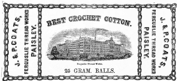
Coton à crocheter.

J. & P. Coats , fabricants, Ferguslie Thread Works, Paisley (Ecosse).