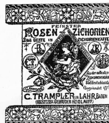
Cichorienkaffee genannt „Rosencichorien“.