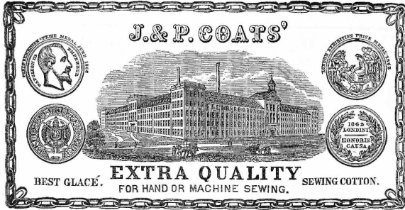
Fil de coton.

J. & P. Coats , fabricants, Ferguslie Thread Works, Paisley (Ecosse).