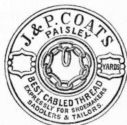
Fil de coton pour cordonniers, selliers et tailleurs.

J. & P. Coats , fabricants, Ferguslie Thread Works, Paisley (Ecosse).