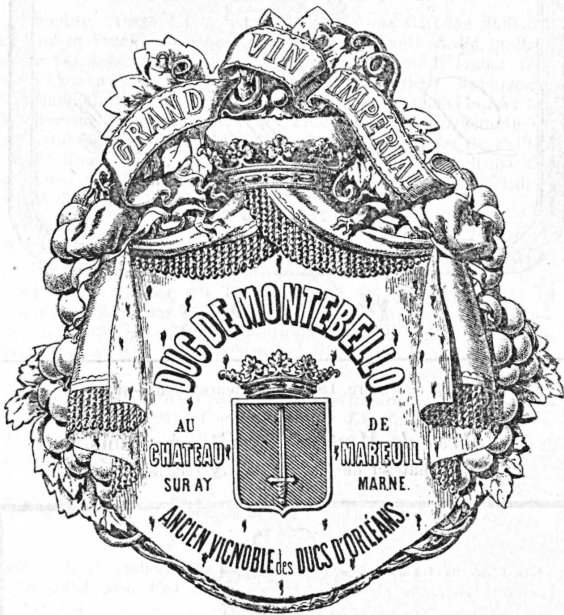
Vin de Champagne (à apposer sur bouteilles).