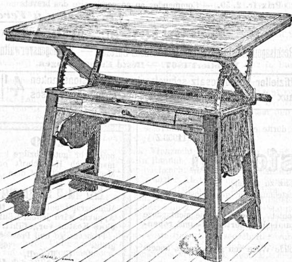
Modèle spécial pour le dessin et les travaux manuels dans les écoles.

pour dessinateurs, architectes, ingénieurs, teneurs de livres et pour les maisons de coupe et de couture.