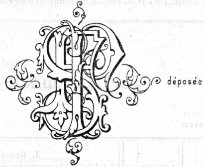
Papiers en tous genres.

Fabrique de papier de Serrières, Serrières près Neuchâtel (Suisse).