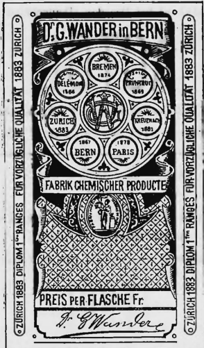
Pharmazeutische und chemische Produkte.