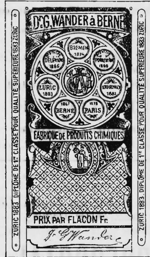
Pharmazeutische und chemische Produkte.