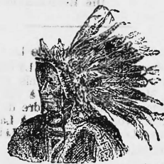
Verarbeiteter und unverbereiteter Tabak.

The American Tobacco Company, Fabrikanten, London (Grossbritannien) und New-York (Nordamerika).