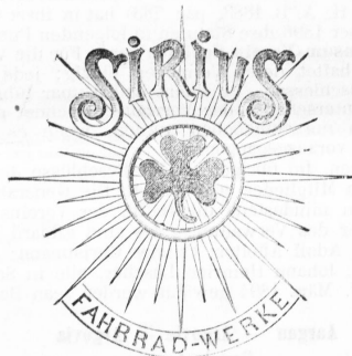
Fahrräder, Fahrradteile und Fahrradzubehör.

Sirius Fahrradwerke Doos-Nürnberg mit beschränkter Haftung, Fürth (Deutschland).