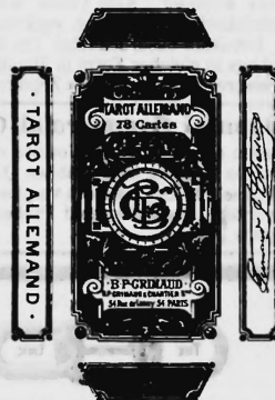
Cartes à jouer.

Nr. 10,563. — 16 novembre 1898, 8 h. a. Grimaud & Chartier , fabricants, Paris (France).