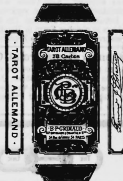
Cartes à jouer.

Nr. 10,563. — 16 novembre 1898, 8 h. a. Grimaud & Chartier , fabricants, Paris (France).