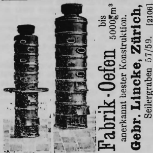
bis 5000 kg m 3 Fabrik-Oefen anerkant bester Konstruktion. Gebr. Lincke, Zürich, Seilergraben 5/7/59. [2106]