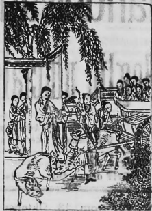
Die Jungfrau vom Spa-scha-Berge

Carl Breiding & Sohn, Kaufleute, Soltau (Deutschland).