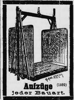
Aufzüge (1692) jeder Bauart.