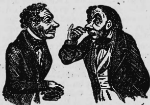
Wie finden Sie ihn? — Delicat! Famos!