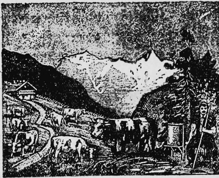
Troupeau. — Heerde.

N° 17920. — 10 novembre 1904, 8 h. Société laitière des Alpes Bernoises, Stalden (Emmenthal, Suisse). Lait et produits laitiers.