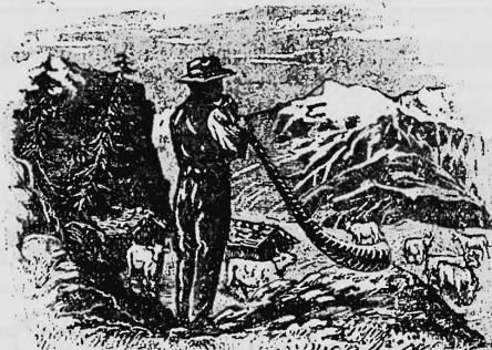
Cor des Alpes. — Alphorn.