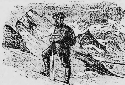
Guide de Montagne. — Bergführer.