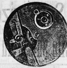
N o 27.

N o 13214. 12 mai 1906, 8 h. p. — Ouvert. — 3 modèles. — Mouvements de montres. — Chatelain, Voumard & C o , Tramelan-dessous (Suisse).