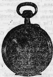
N o 3.