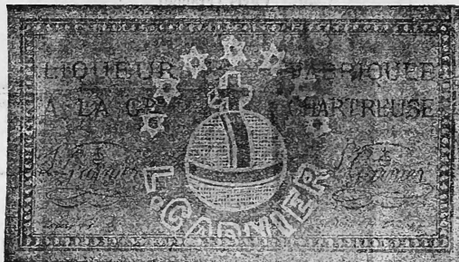
L'étiquette est à fond vert.

(Le dessin aux contours blancs, représentant un globe surmonté d'une croix et entouré dans sa partie supérieure de sept étoiles, dans sa partie inférieure du nom de L. Garnier en lettres capitales, apparaît en filigrane transparent dans la pâte du papier sur lequel la marque est imprimée.)