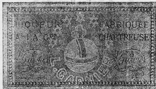
L'étiquette est à fond jaune.

(Le dessin aux contours blancs, représentant un globe surmonté d'une croix et entouré dans sa partie supérieure de sept étoiles, dans sa partie inférieure du nom de L. Garnier en lettres capitales, apparaît en filigrane transparent dans la pâte du papier sur lequel la marque est imprimée.)