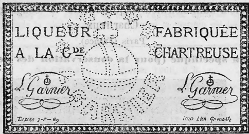
Figure A: Le dessin représentant un globe surmonté d'une croix, apparaît en filigrane dans la pâte du papier sur lequel la marque est imprimée.