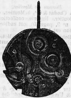
N o 193.