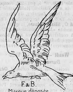
F & B. Marque déposée.

Margarine, Kochfett, Cocosnussfett, Schweinefett, Nierenfett und Speiseöle.