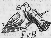
F & B

Margarine, Kochfett, Cocosnussfett, Schweinefett, Nierenfett und Speiseöle.