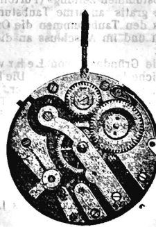
N o 1.