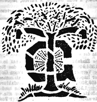
(Uebertragung der Marke Nr. 7403 von Th. Goldschmidt.)