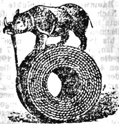
(Transmission du n° 6040 de George Cradock & Co.)