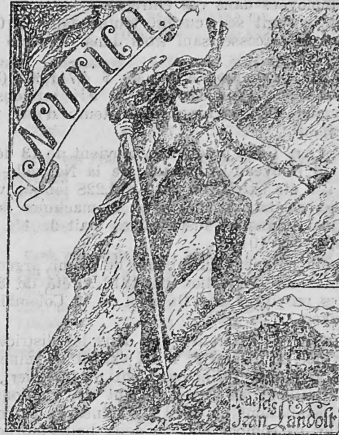
(Uebertragung der Marke Nr. 31120 von Jean Landolt.)