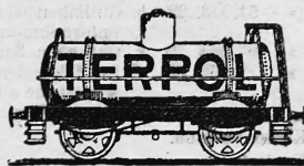
(Uebertragung von Nr. 27197 der Firma Terpol A.-G., Zürich.)

Nr. 37005. — 24. Juni 1915, 8 Uhr. Chemische Industrie Aktiengesellschaft in Zürich, Fabrikation und Handel, Zürich (Schweiz). Erdölprodukte.