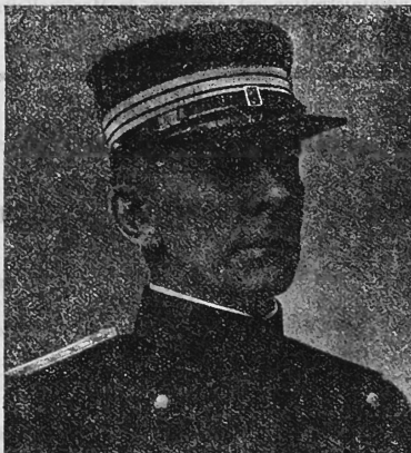
Sprecher von Bernegg Generalstabschef