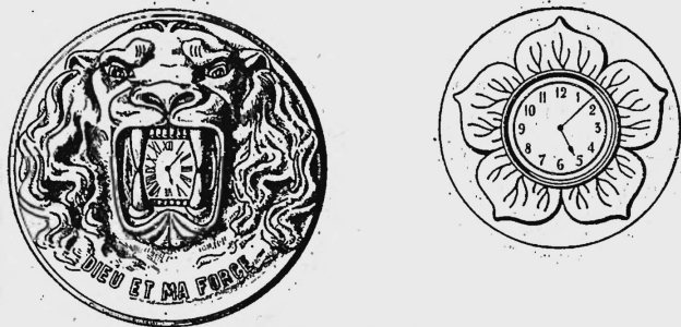
Nr. 4 Nr. 5

Nr. 28020. 20. April 1917, 8 h. p. — Ouvert. — 2 modèles. — Montres. — Auguste Molly, Genève (Suisse). Mandataire: H. Chaponnière, Genève.