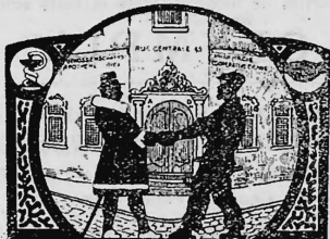
Genossenschafts-Apotheke Pharmacie coopérative Biel - rue centrale 45 - Bienne

Nr. 48126. — 11. November 1920, 5 Uhr. Genossenschaftsapotheke von Biel und Umgebung , Fabrikation und Handel, Biel (Schweiz). Pharmazentische Produkte, Sanitätsartikel.