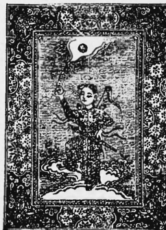
(Erneuerung der Nr. 23073).

Metalle in rohem und teilweise verarbeitetem Zustande (Bleche, Stangen, Blöcke, Draht, Bänder); metallene Beleuchtungs-, Heizungs-, Koch- und Ventilations-Apparate, metallene Beleuchtungs-, Heizungs-, Koch- und Ventilations-Geräte, metallene Löffel, Messer, Gabeln, Werkzeuge, sowie Nadeln jeglicher Art, Fischangeln, Nägel, Schrauben, Metall-Gusswaren, emaillierte, verzinnte oder lackierte Knöpfe; Schmucksachen, Gold- und Silber-Gespinnste auf Baumwolle und Seide; Fensterglas, Lampenzylinder, Lampenschirme, Farben, Farbwaren und Farbstoffe; Uhren (Metall und Holz), Zündhölzer (Wachs und Holz), Lichte, einschl. Nachtlichte, Seife, Baumwolle und baumwollene Verbandstoffe, baumwollene Garne, Zwirne, Bindfäden, Gespinnstfasern und Schirme, baumwollene Spitzen, baumwollene gestrickte, gewirkte und gewebte Stoffe, gemischt oder ungemischt, einschl. baumwollene Bänder, Sammete, Plüsch und Dochte; gewirkte oder gewebte Stoffe, gemischt oder ungemischt, aus Seide, Flachs, Hanf, Leinen, Jute, Wurmkuhen, Biskuits, Gummipuppen, Gummischuhe, Gummisohlen, Gummidecken, Gummibänder, Gummikämme, Maschinen, Maschinenteile, Wolle und wollene Garne, Wollfäden, wollene Gespinnstfasern und Spitzen, wollene, gestrickte, gewirkte und gewebte Stoffe, gemischt oder ungemischt, einschl. wollene Bänder, Sammete, Plüsch und Flanelle, Zelluloidbälle, Uhrketten, Konserven wie Fleischspeisen und Gemüse, Wein, Bier und Spirituosen.