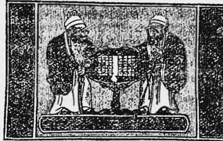
(Erneuerung der Nr. 23076).

mischt oder ungemischt, einschl. baumwollene Bänder, Sammete, Plüsch und Dochte, gewirkte oder gewebte Stoffe, gemischt oder ungemischt, aus Seide, Flachs, Hanf, Leinen, Jute, Wurmkuhen, Biskuits, Gummibälle, Gummipuppen, Gummischuhe, Gummisohlen, Gummidecken, Gummibänder, Gummikämme, Maschinen, Maschinenteile, Wolle und wollene Garne, Wollfäden, wollene Gespinnstfasern und Spitzen, wollene, gestrickte, gewirkte und gewebte Stoffe, gemischt oder ungemischt, einschl. wollene Bänder, Sammete, Plüsch und Flanelle, Zelluloidbälle, Uhrketten, Fleischspeisen und Gemüse, Wein, Bier und Spirituosen.