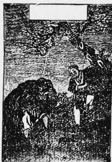
(Erneuerung der Nr. 23072).

Metalle in rohem und teilweise verarbeitetem Zustande (Bleche, Stangen, Blöcke, Draht, Bänder); metallene Beleuchtungs-, Heizungs-, Koch- und Ventilations-Apparate, metallene Beleuchtungs-, Heizungs-, Koch- und Ventilations-Geräte, metallene Löffel, Messer, Gabeln, Werkzeuge, sowie Nadeln jeglicher Art, Fischangeln, Nägel, Schrauben, Metall-Gusswaren, emaillierte, verzinnte oder lackierte Knöpfe; Schmucksachen, Gold- und Silber-Gespinnste auf Baumwolle und Seide; Fensterglas, Lampenzylinder, Lampenschirme, Farben, Farbwaren und Farbstoffe; Uhren (Metall und Holz), Zündhölzer (Wachs und Holz), Lichte, einschl. Nachtlichte, Seife, Baumwolle und baumwollene Bekleidungsstücke und Verbandstoffe, baumwollene Garne, Zwirne, Bindfäden, Gespinnstfasern und Schirme, baumwollene Spitzen, baumwollene gestrickte, gewirkte und gewebte Stoffe, gemischt oder ungemischt, einschl. baumwollene Bänder, Sammete, Plüsch und Dochte, gewirkte oder gewebte Stoffe, gemischt oder ungemischt, aus Seide, Flachs, Hanf, Leinen, Jute, Wurmkuhen, Biskuits, Gummipuppen, Gummischuhe, Gummisohlen, Gummidecken, Gummibänder, Gummikämme, Maschinen, Maschinenteile, Wolle und wollene Bekleidungsgegenstände, wollene Garne und Wollfäden, wollene Gespinnstfasern und Spitzen, wollene gestrickte, gewirkte und gewebte Stoffe, gemischt oder ungemischt, einschl. wollene Bänder, Sammete, Plüsch und Flanelle, Zelluloidbälle, Uhrketten, Konserven wie Fleischspeisen und Gemüse, Wein, Bier und Spirituosen.