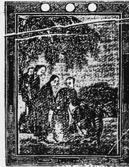
(Erneuerung mit Gebrauchseinschränkung der Nr. 23075).

Spitzen, wollene, gestrickte, gewirkte und gewebte Stoffe, gemischt oder ungemischt, einschl. wollene Bänder, Sammete, Plüsch und Flanelle, Zelluloidbälle, Uhrketten, Fleischspeisen und Gemüse, Wein, Bier und Spirituosen.