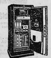
Komplette Stahlkammer Kassenschränke 1000 Einmuerkassen

Ecrire sous chiffre H 6115 X à Publicitas, Genève.