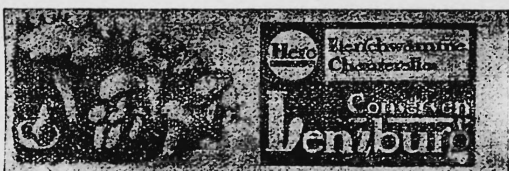
(Wiedergabe der Pilze in Naturfarben [gelb und grün] auf weissem Grund).

Eierschwämme-Konserven, Reklame-Artikel und Geschäftspapiere.