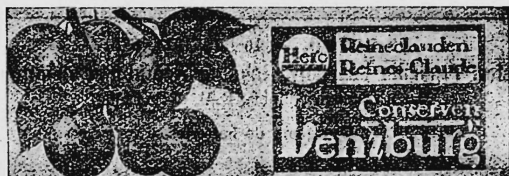
(Wiedergabe der Früchte in Naturfarben [grün und braun] auf weissem Grund).

Reineclauden-Konserven, Reklame-Artikel und Geschäftspapiere.