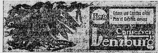
(Wiedergabe der Gemüse in Naturfarben [grün und rot] auf weissem Grund).

Erbsen- und Karotten-Konserven, Reklame-Artikel und Geschäftspapiere.