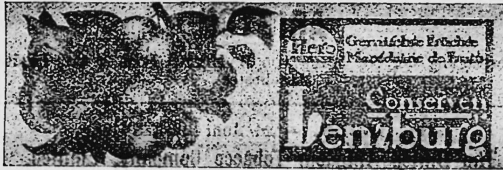
(Wiedergabe der Früchte in Naturfarben [gelb, orange, rot, blau, grün und braun] auf weissem Grund).

Gemischte-Früchte-Konserven, Reklame-Artikel und Geschäftspapiere.