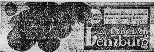
(Wiedergabe der Früchte in Naturfarben [rot und grün] auf weissem Grund).

Erdbeer-Konserven, Reklame-Artikel und Geschäftspapiere.