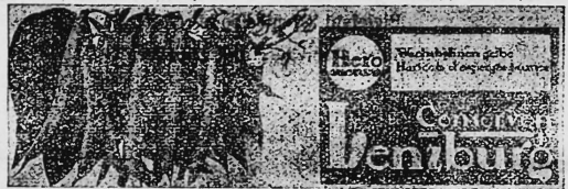
(Wiedergabe der Gemüse in Naturfarben [grün, gelb und lila] auf weissem Grund).

Gelbe Wachsbohnen-Konserven, Reklame-Artikel und Geschäftspapiere.