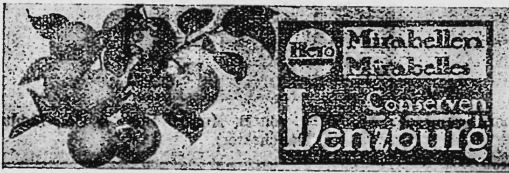
(Wiedergabe der Früchte in Naturfarben [gelb, grün und braun] auf weissem Grund).

Mirabellen-Konserven, Reklame-Artikel und Geschäftspapiere.