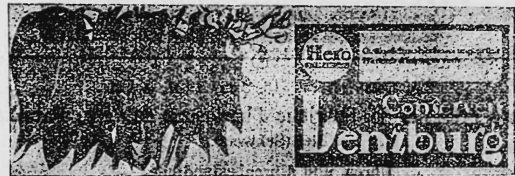
(Wiedergabe der Gemüse in Naturfarben [grün, gelb und lila] auf weissem Grund).

Grüne Schmalzbohnen-Konserven, Reklame-Artikel und Geschäftspapiere.