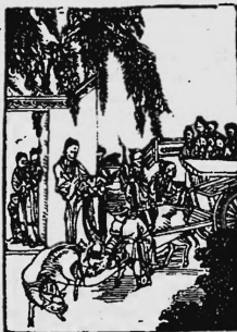
Die Jungfrau vom Hoss-schau Berg