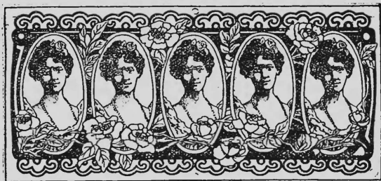
(Uebertragung der Nr. 20710 von Chemische Fabrik Griesheim-Elektron, Frankfurt am Main).

Künstliche, organische Farbstoffe und andere chemische Produkte, insbesondere Zwischenprodukte für Farbenerzeugung, Färberei, Zeugdruckerei und Lackfabrikation, sowie Heilmittel.